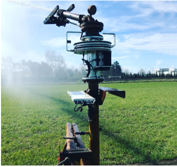
Die Montage einer Sektorverstellung auf einem Regnerwagen.